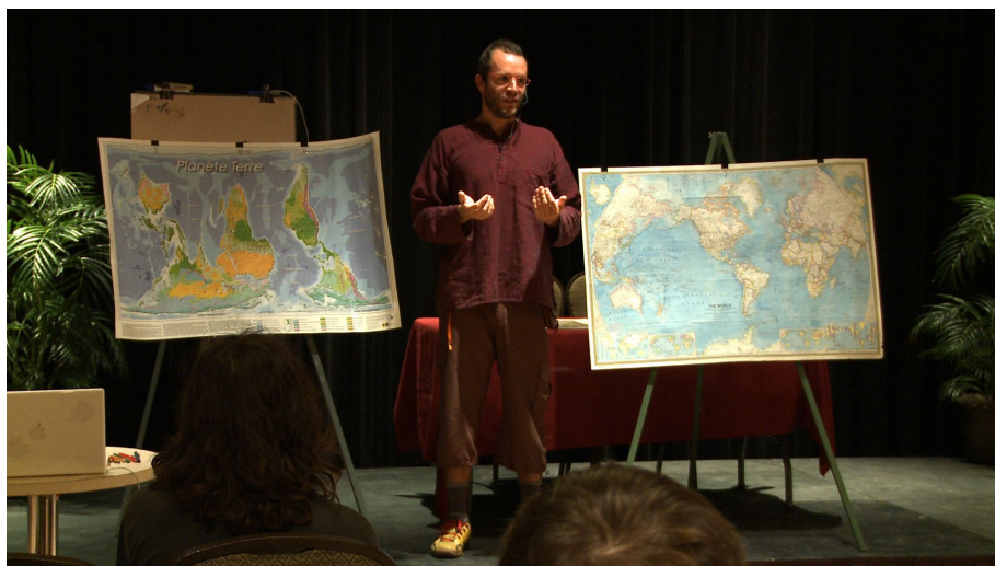
Conférence gesticulée du 16/10/2013 à Québec (Canada)